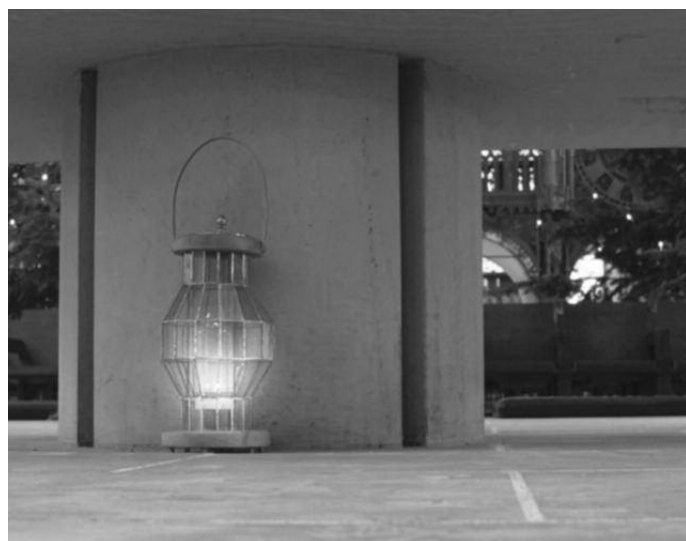
Das Friedenslicht aus Bethlehem vor dem Altar im Dom

Kindergruppen: Betty von Rhein Telefon 48983750 kindergruppen@domzuluebeck.de