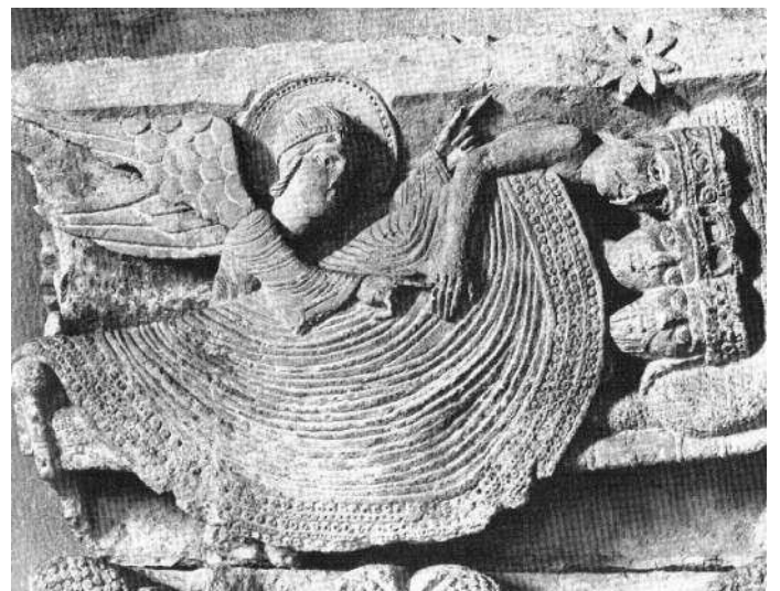
Relief in der Kathedrale von Autun

Drei König' kamen, ihn zu suchen, der Stern führt' sie nach Bethlehem. Kron' und Zepter legten sie ab, brachten ihm, brachten ihm, brachten ihm ihre reiche Gab.